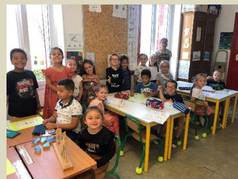
Grande Section - CP